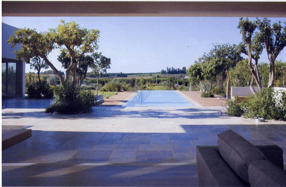
בית פרטי בשרון. אדריכל מורן פלמוני.