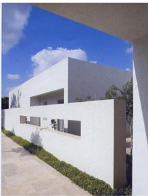
House in the Sharon. Architect Moran Palmoni.